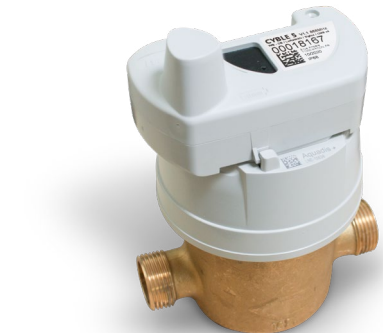
Aquadis+ equipado con el módulo Cyble 5